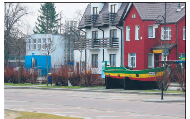
Sołtys Grzybowa rozpoczął konsultacje w sprawie pomysłu utworzenia nowej gminy, która skupiała by miejscowości wokół jeziora Resko.