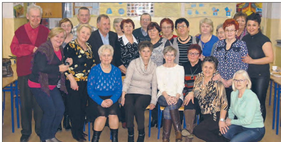
W ramach nowego projektu partnerskiego odbędzie się cykl spotkań. Członkowie „Aramisa” to bardzo żyta i serdeczna społeczność.

TRZEBIATÓW. Krajowe Stowarzyszenie Aramis w Trzebiatowie ruszyło z nowym przedsięwzięciem. Przed tygodniem odbyło się pierwsze spotkanie w ramach projektu