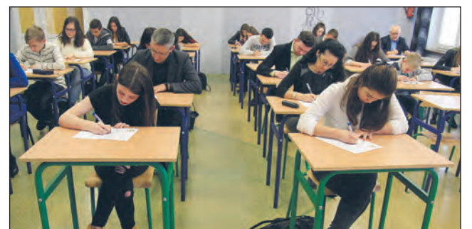
Choć nie liczył się wynik, każdy chciał wypaść na dyktandzie jak najlepiej.