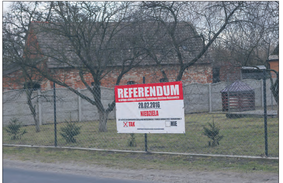
Urząd początkowo uzależniał podpisanie aneksu do umowy użyczenia budynku szkoły od zdjęcia plakatu referendalnego z ogrodzenia.