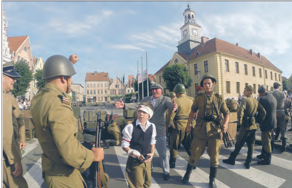
Inscenizacja związana z Powstaniem Warszawskim cieszy się ogromnym zainteresowaniem.