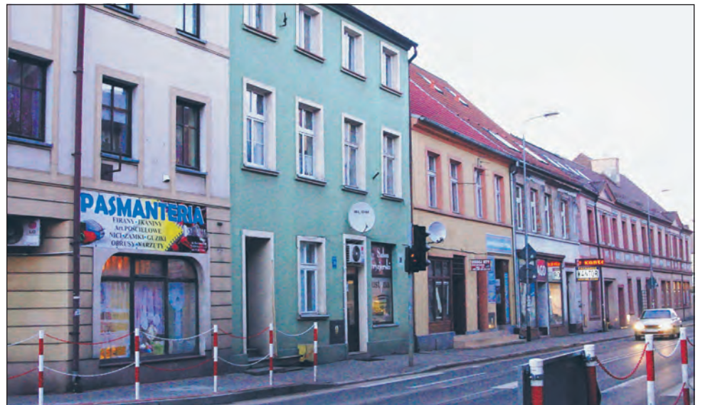
30 dni ma prezes na powiadomienie o upadłości oraz o tym, jak zostaną uregulowane wierzycielności wobec dłużników.

„Puls Miasta” dotarł do nieoficjalnych informacji, z których wynika, że ZBK nadal zadłuża się wobec wspólnot. Od stycznia należność, którą spółka jest winna wodociągom z tytułu zarządzania wspólnotami (pieniądze, które mieszkańcy płacą za wodę) wzrosła o 108 tys. złotych i wynosi już blisko 850 tys. złotych (na 31.12.2015 była to kwota 740 tys. zł). Wychodzi, więc na to, że ZBK nie zmienia polityki i pieniądze, jakie otrzymuje od wspólnot „przejada” na bieżą-