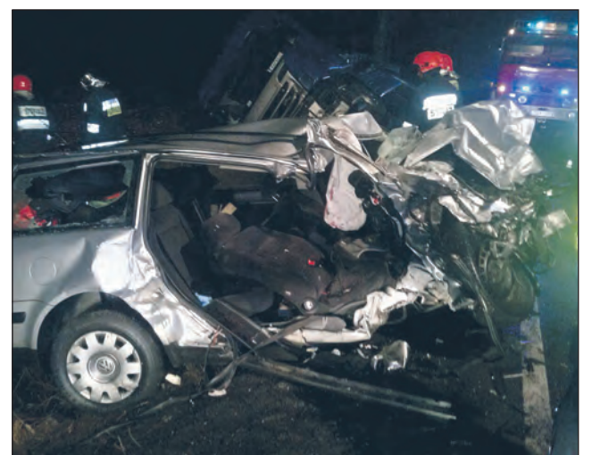
Kierowca Volkswagena wyprzedzał na „trzeciego”. Auto zderzyło się czołowo z ciężarówką.

po północy. Kierowca tira, który także został zatrzymany na obserwację – jest w szoku. Tłumaczy, że próbował wszystkiego, by uniknąć zderzenia z osobówką. Wyprowadził ciężarówkę na pobocze, która w poślizgu przewróciła się na bok. Jak ustalił nieoficjalnie Puls Miasta, pasażerowie Volkswagena mogli skorzystać z usługi „bla bla car”, czyli jechać z kierowcą, który zaoferował miejsca w swoim aucie. To wersja, której na tę chwilę nie potwierdza policja. mada