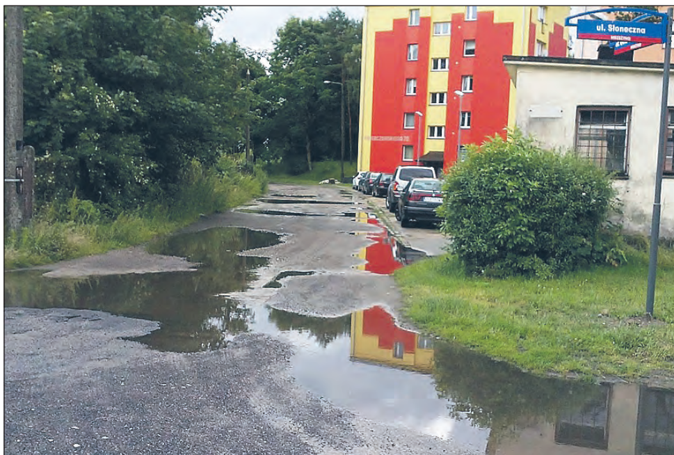
Ulewnie deszcze zmieniają Osiedle za Regą w krainę jezior. Gmina od lat nie inwestuje na tym terenie.

Burmistrz Matusewicz mówi o dwóch Mrzeżynach (o tym, które płaci podatki od turystów i o tym, które na tym żeruje - czyli o naszym Osiedlu). To nie tylko arogancja, ale przede wszystkim kompletna nieprawda. Pan burmistrz zapomniał, że oprócz