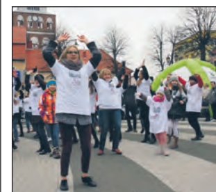
Tańczyli i protestowali już po raz trzeci.

„One Billion Rising” już po raz trzeci zgromadził mieszkańców Gryfic na Placu Zwycięstwa. - Takie spotkania dają pretekst do rozmowy, są o wiele skuteczniejsze niż ulotki - mówi Anna z Gryfic.